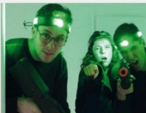
DÉFI RÉALITÉ VIRTUELLE ANTARÈS

Quelques idées pour compléter et enrichir votre événement :