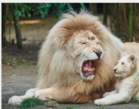
PRIVATISATION DU PARC ZOO DE LA FLÈCHE