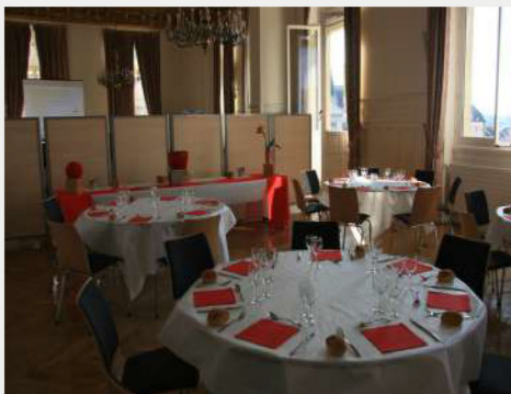
DÎNER AU CENTRE VILLE CCI LE MANS - SARTHE

Quelques idées pour compléter et enrichir votre événement :