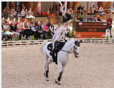
SPECTACLE DE VOLTIGE PÔLE EUROPÉEN DU CHEVAL